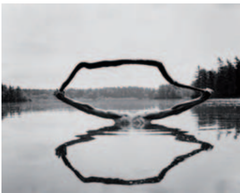
A.R. Minkkinen - Fosters pond - 1993

Box Galerie 88, rue du Mail - 1050 Bruxelles Tél: 02/537 95 55 www.boxgalerie.be Du mercredi au samedi, de 14 à 18 heures Vernissage le vendredi 19 juin de 18 à 21 h