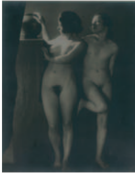
Drtikol Frantisek - "Deux femmes nues avec vase" - 1922 23,5 cm x 29,5 cm