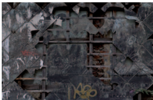
Isabelle HAYEUR - "Congo reconnaissant I" -2008, 2009 Impression chromogénique plastifiée - 103 cm x 159 cm

Le Café Français Art Gallery Rue Ernest Allard, 43 - 1000 Bruxelles Tél: 02/502 78 24 - Gsm: 0486 296 839 www.lecafefrançais.be Ouvert du mercredi au vendredi de 14 à 18h Samedi de 12 à 18 h Vernissage le vendredi 19 juin de 18 à 21 h