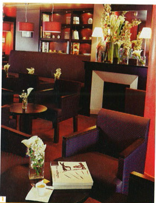
1 - "Le Shamaïbar" du Bleu Marine 2 - La cabine du spa Opaline Marine